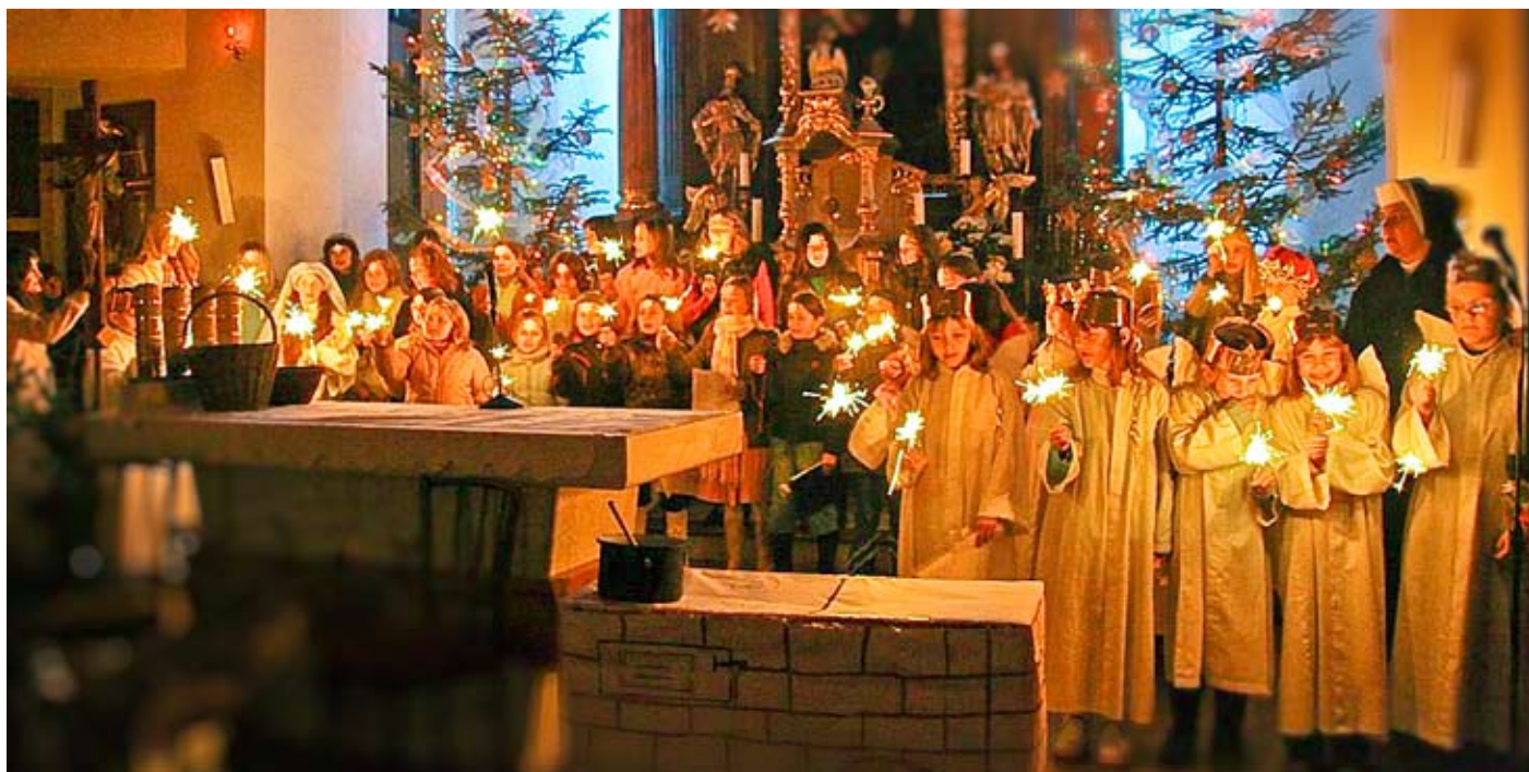
Záver Jasličkovej pobožnosti bol veľmi dojímavý