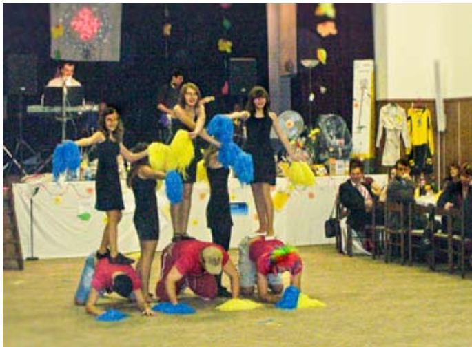
Skupina „Krvinky“ v akcii

Na plese môžete stretnúť svojich blízkych, priateľov, známych, svojich susedov.