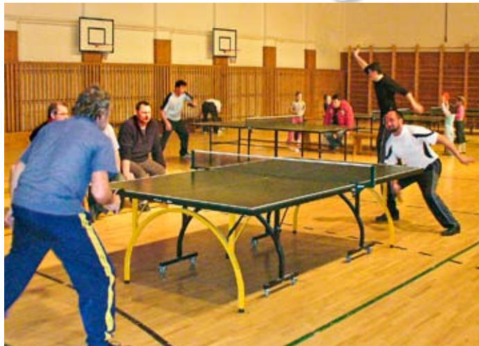
Hralo sa so správnym športovým zápalom

Aj tohtoročný novoročný stolnotenisový turnaj ukázal, že základňa stolného tenisu v Kline je v celku široká, ale len čo sa týka kategórie mužov, keďže sa v nej stretlo približne 30 hráčov.