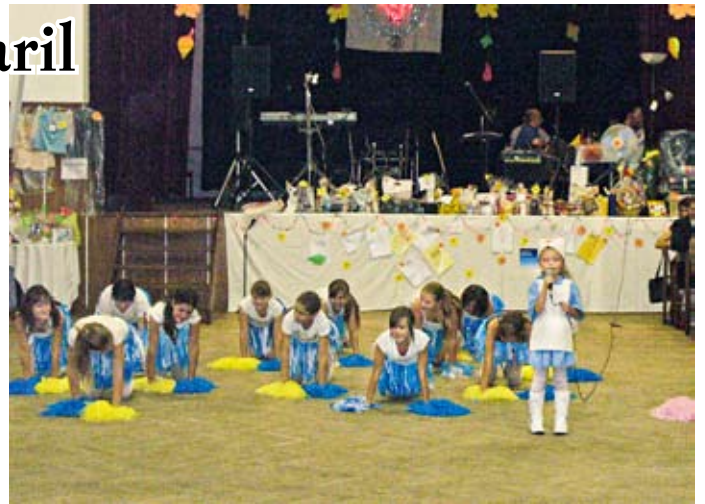
Program plesu spestrili kliňanské mažoretky