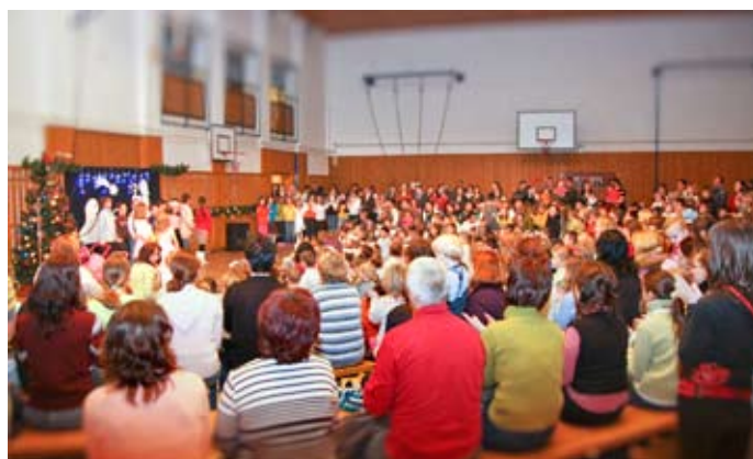
Pred Vianocami v škole nechýba bohatý program, ktorý si vždy radi pozrú nielen spolužiaci, ale aj rodičia