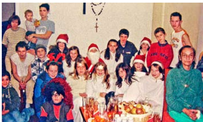
Mikuláš navštívil Dom Charitas Sv. Hildegardy z Bingenu v Rabči

Posledný deň pred vianočnými prázdninami sa škola zmenila na malé trhovisko. Niektorí žiaci si tento rok dali záležať a pripravili originálne ručne zhotovené výrobky, iní sa zas postarali o kvalitné občerstvenie. V rámci týchto