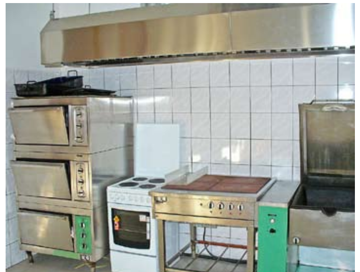
Práci pomáha aj nové odvetrávanie

Obrusy vyčistí každý na vlastné náklady, poškodený inventár sa platí pri zúčtovaní.