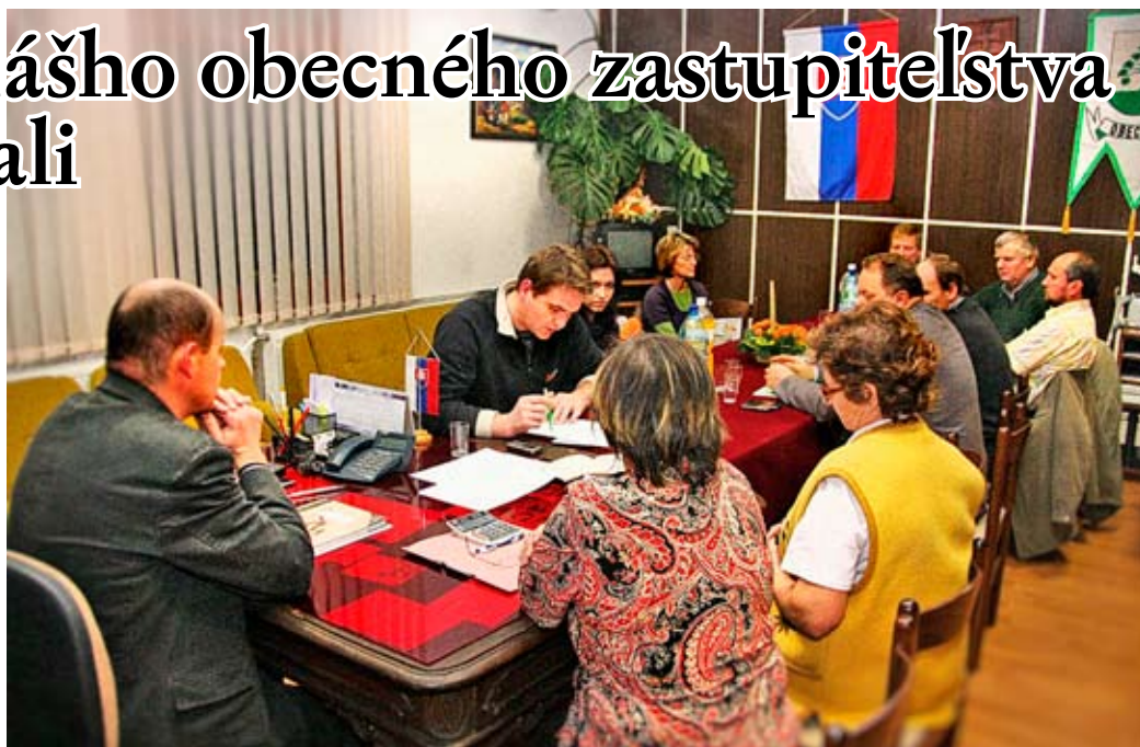
Na zasadaní obecného zastupiteľstva