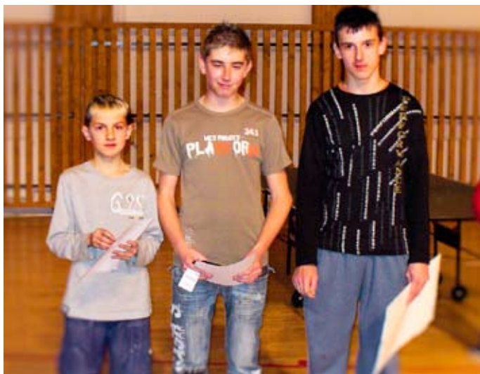
Mladí stolní tenisti po prebratí ocenenia

Dokončenie => Galčík – Katrák 3:0, 2. skupina