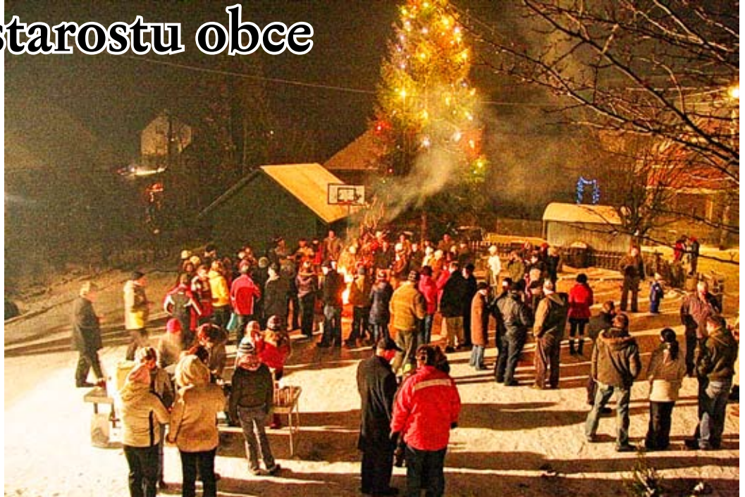
Pred polnocou množstvo Kliňanov zamierilo do kostola poďakovať sa Bohu za uplynulý rok. Potom sa, už tradične, pristavili na parkovisku pod kostolom a pripili si punčom pripraveným MS SČK

Nový rok 2009 je už v plnom prúde, ale ešte stále v nás doznieva čaro Vianoc, ktoré zanechali pohladenie na duši, dodali nám nádej a silu ísť do ďalších dní s optimizmom, aj napriek rôznym zneisťujúcim predpoveďami. Určite nikto z nás nemá čarovný prútik na riešenie a náhlu zmenu rôznych problémov, ktoré nám pripravuje život. Ale nemôžeme pripustiť, aby sa život zastavil na mŕtvom bode a nás nechal pasívnymi. Musíme pozbierať všetky sily a popasovať sa s problémami, ktoré nám doba prináša. Nemali by sme sa uzatvárať do seba, prestať sa snažiť o zmenu, prestať spolu komunikovať a poddať sa beznádeji a pesimizmu. Verím, že sa nám v našej obci aj v tomto roku podarí, vzájomnou dôverou, stavať na započatej práci, rozvíjať ďalšie plány a nebáť sa prekážok.