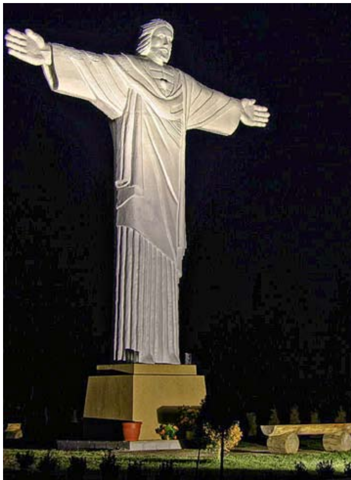
Socha Krista Spasiteľa upútava pozornosť i za noci

Dnes už berieme sochu Krista Spasiteľa ako samozrejmosť. Akoby tu stála od nepamäti. Stala sa cieľom výletov a spoločnej modlitby našich ľudí i jej obdivovateľov z blízkyh dedín. Dnes už sochu vidno nielen za krásneho slnečného počasia, ale aj v noci, keďže je osvetlený halogénovým reflektorom.