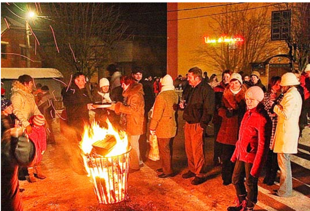
Prítomní si navzájom priali všetko len to najlepšie do roku 2009 a po polnoci sa kochali z bobateho ohňostroja

trafostanice, rozvod nízkeho napätia s prípojkami a položenie prívodného kábla od vysokého napätia k trafostanici na Kunovej ulici o celkových nákladoch 3544750 Sk. Zrekonštruovalo sa vysoké napätie od p. Romaňáka až na vyšný koniec obce. Pri obecnom úrade sa vybudovalo parkovisko so 16 parkovacími miestami v hodnote 714 000 Sk. Veľké úsilie zo strany obecného úradu, poslancov OZ bolo vinuté pri riešení problémov s výstavbou kanalizácie s tým, že termín ukončenia výstavby kanalizácie bol posunutý na rok 2009 s následnou rekonštrukciou cesty prechádzajúcou našou obcou. Samospráva obce venovala veľký dôraz na prípravu projektov v rámci výziev z fondov EU. V prvom rade to bola príprava a podanie projektu „Rekonštrukcia základnej školy s materskou školou“. Čas a namáha s prípravou projektu boli zúčročené v podobe schválenia