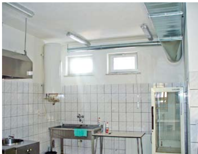
Zo stiesnenej kuchyne vznikla krásna priestraná miestnosť, v ktorej je radosť variť

108 € (3253,61 Sk) – prenájom miestnosti + kúrenie + upratovanie;