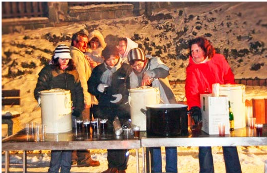
„Ale mrzne! Ešteže ten punč je taký teplučký!“ – členky MS SČK pri príprave novoročného punču