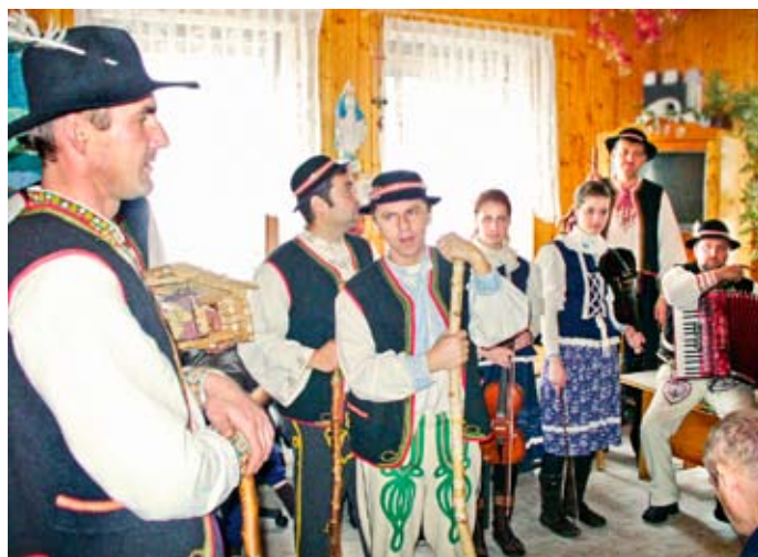
Pri „betlehemovaní“ v Ústave sociálnej starostlivosti v Zákamennom