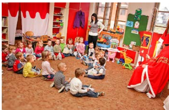
I tí menší nechceli zaostvať a prezentovali sa svojimi umeleckými prejavmi