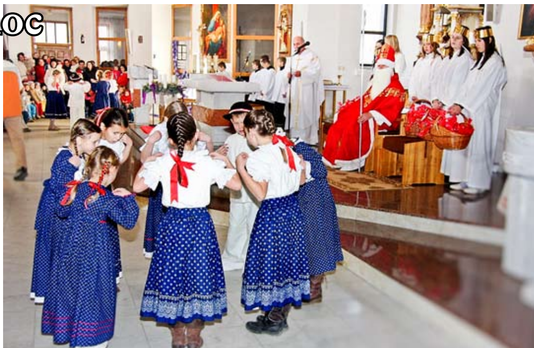
Pred Vianocami prišiel do kostola Sv. Mikuláš, ktorému deti ukázali svoje talenty i v progame