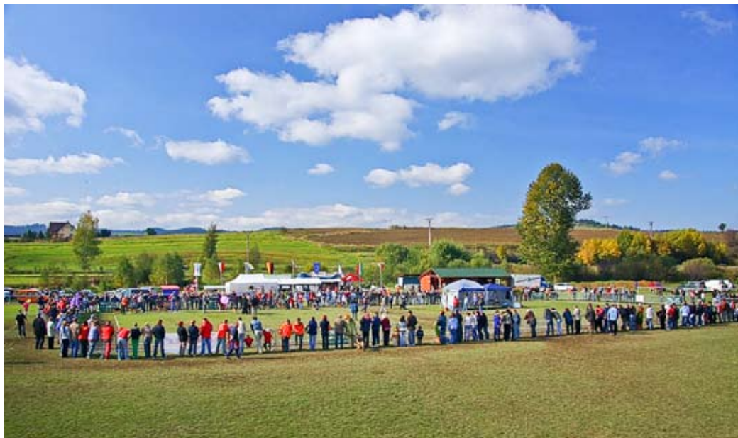
V nedeľu sa ihrisko zaplnilo divákmi, ktorí obdivovali nádherných psov