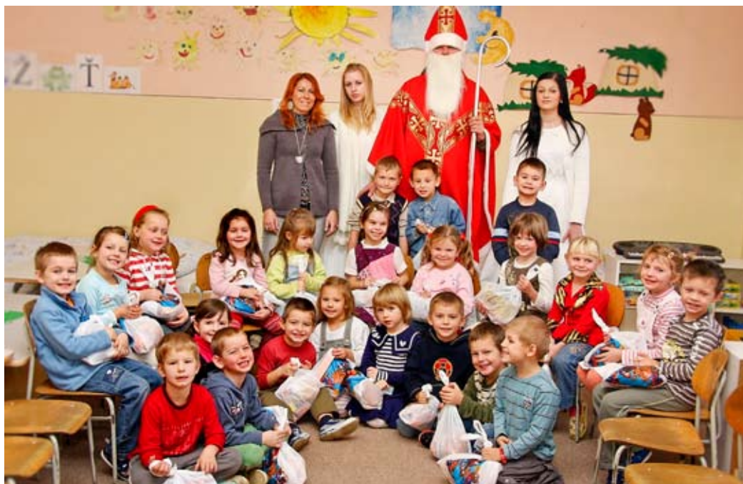
Spoločná fotka s Mikulášom je tiež zážitok

Prezlečení za Mikuláša, čertov a anjelov spríjemnili sviatočné chvíle deťom žijúcim v Dome Charitas Sv. Hildegardy z Bingenenu pre sociálne slabšie rodiny v Rabči. Za sladkosti, darčeky, šatstvo a milý program boli patrične odmenení. Spolu, s tam momentálne žijúcimi deťmi s mamičkami, si zaspievali a porozprávali sa. Sami siedmáci sa vyjadri,