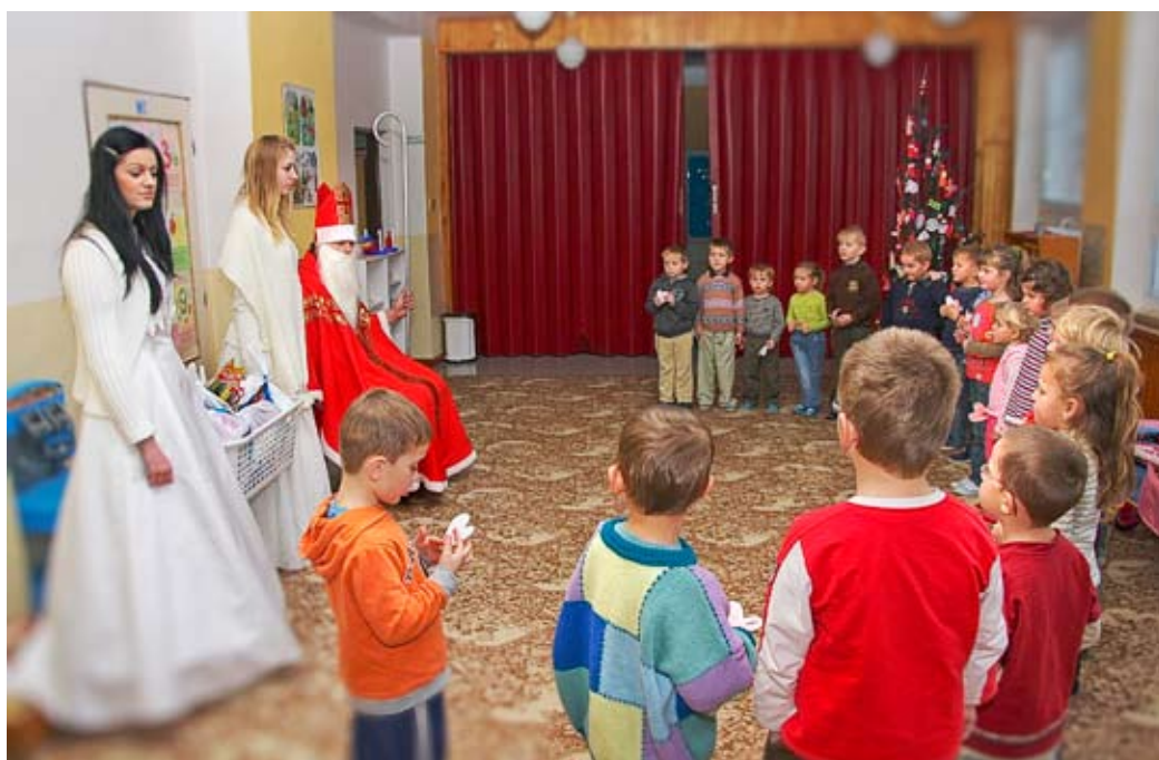
Materská škôlka privítala v decembri Mikuláša. Každý škôlkar sa snažil urobiť čo najlepší dojem a svojimi básničkami si vyslúžiť mikulášsku nádielku a obdiv Mikuláša a jeho anjelov

sv. Mikuláša, Vianočná besiedka a Vianočné trhy v našej škole.