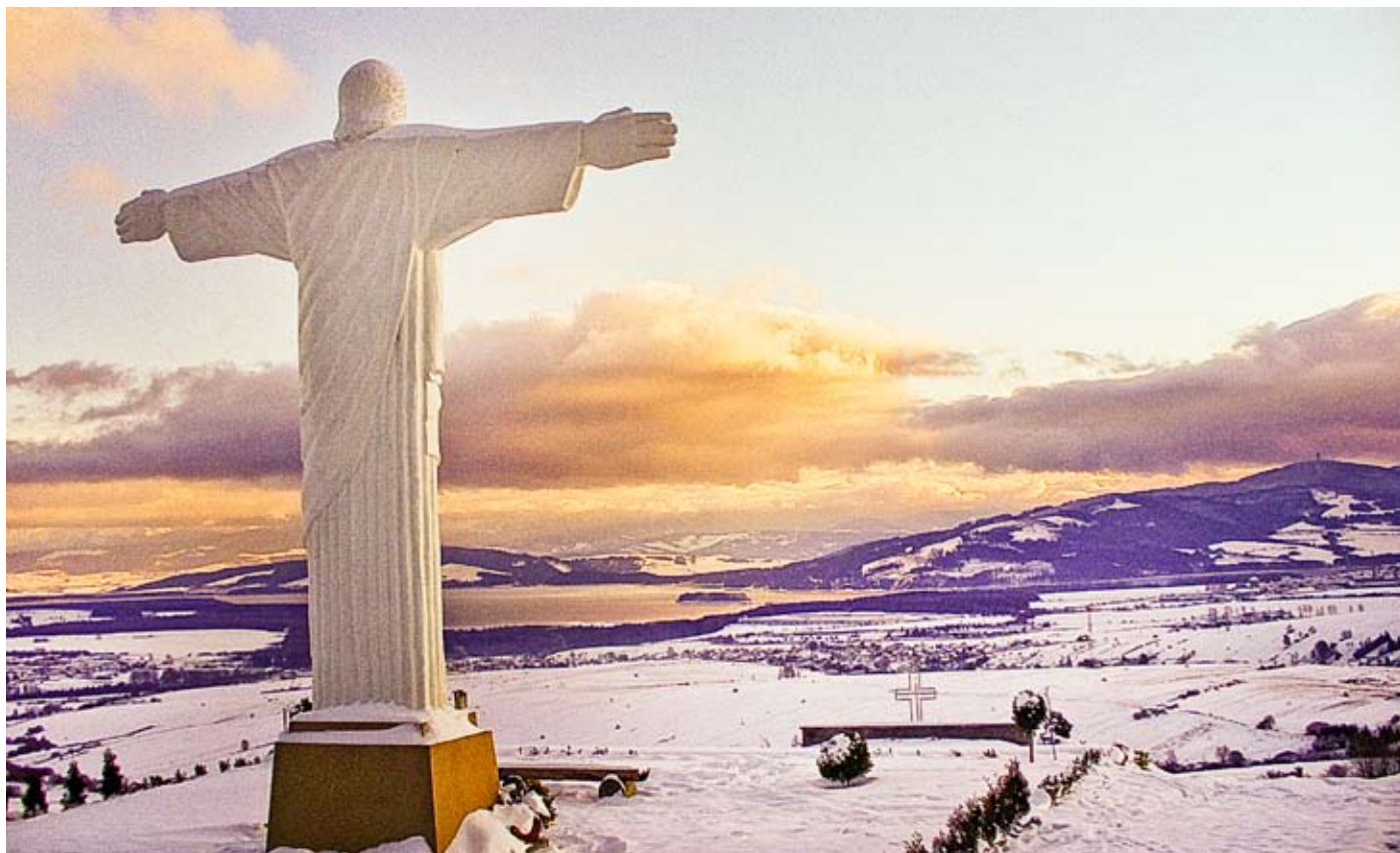
Panoráma z tohto miesta je úchvatná