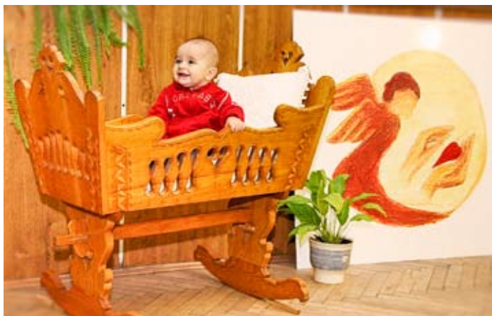
„Nuž, a tu sa mi páči! Veru, ani odtiaľto nevylezím!“

kolísky, do ktorej ich ich rodičia symbolicky posadili. Žiačky ZŠ v Klíne predniesli peknú báseň o anjelovi, ktorý má meno Mama a tak poukázali na úlohu tejto najbližšej a prvej osoby v živote malého stvorenia. V príhovore starosta obce poblaboženal rodičom a ich deťom, poprial im vela radosti zo života a vyjadril nádej, že naša obec bude i naďalej mladnúť a brdiť sa dobrými ľuďmi. – sestra Imaculáta–