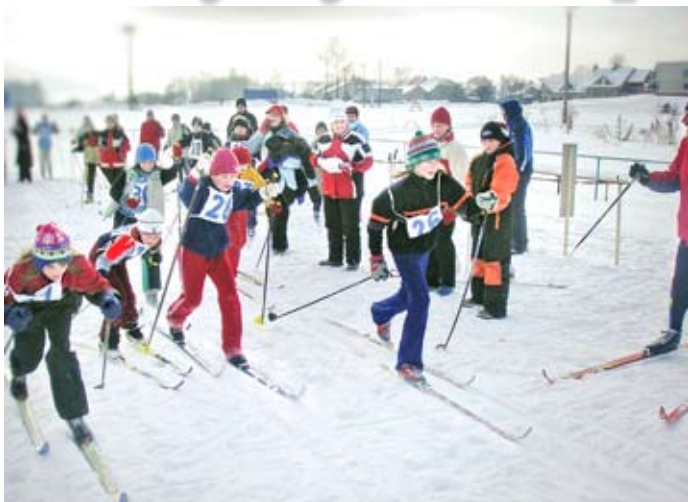
VI. Klišanská biela stopa