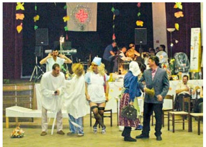
V programe nechýbala ani scéнка zo zdravotníckeho prostredia

A samozrejme poďakovanie patrí hlavne MS SČK v Kline, všetkým členom a členkám, ktorí si každý