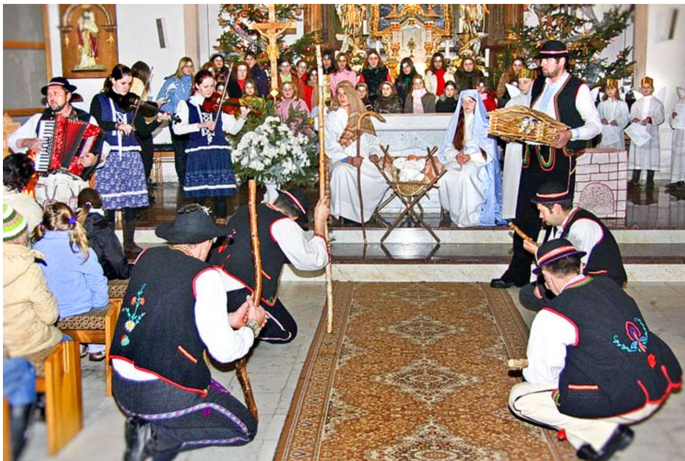
Kliňanskí betlehemci sa prišli pokloniť a obetovať dary malému Ježiškovi