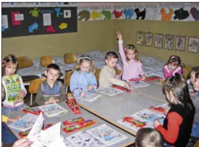
Z akcií MS SČK Čez omaľovánky o prvej zdravotníckej pomoci aj deti z dolnej MŠ získali veľa poznatkov. O ich záujme svedčili aj neustále otázky.