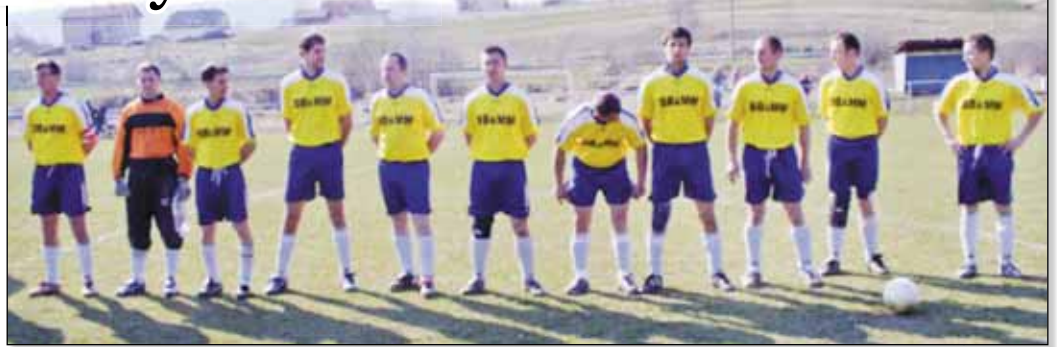
Futbalové mužstvo Klina pred prvým zápasom jarnej súťaže. Bude snaha o záchranu úspešná?