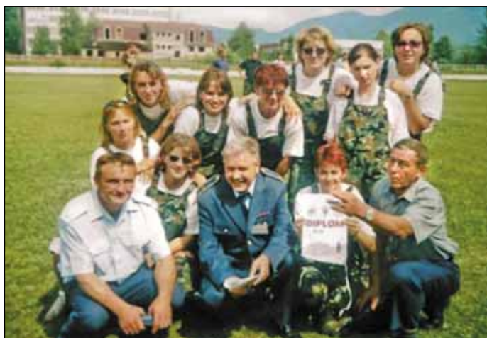
Zo súťaže dobrovoľných hasičských zborov