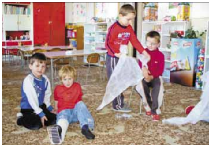
Z akcií MS SČK Deti z hornej MŠ sa správali na prezentácii prvej zdravotníckej pomoci naozaj profesionálne. Budú z nich noví lekári a zdravotníci?