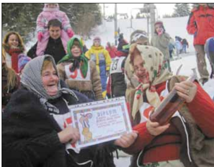
Z akcií MS SČK Na karnevale na snehu sa zabávali mladí i starší bez rozdielu (s maskou, či bez masky).