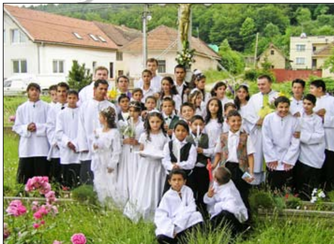
„Zožnámil“ mnohé deti s Bohom a priviedol ich ku svätému prijímaniu