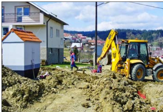
Na Kunovej ulici pribudla ďalšia trafostanica, ktorá umožní rozvod elektrickej energie pre nové domy