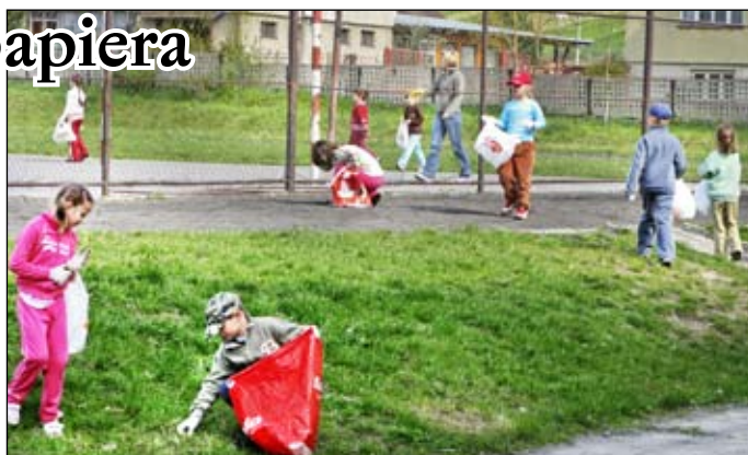
Žiaci pri práci na projekte „Čistá dedina“