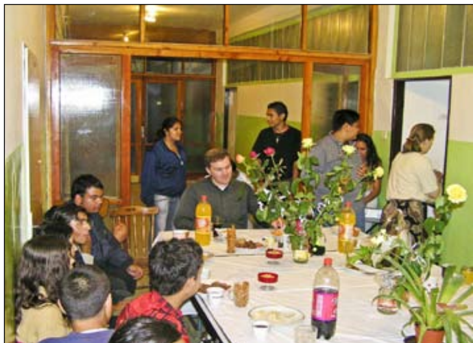
Na spoločnom posedení

Nakoniec Boh dodal: „Nezabudni, ľudia hocikedy zabudnú, čo si pre nich urobil, ale nikdy nezabudnú, ako sa vedľa teba cítili.“ Chvíľu som ešte sedel a tešil sa z Božej prítomnosti. Potom som odišiel ŽIT.