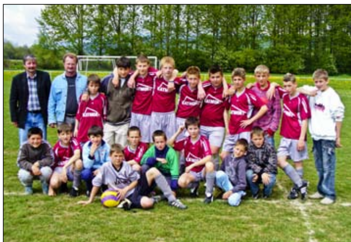
Futbalový tím starších žiakov

Výsledky z 18. mája: muži Klin – Hruštín 1:0, dorast Klin – Breza 9:0, žiaci Klin – Mutné 3:2.