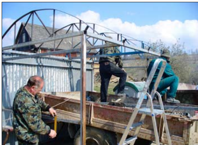
Nová autobusová zastávka na vyšnom konci