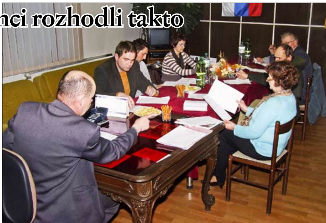
Na zasadnutí Obecného zastupiteľstva v Kline 25. 4. 2008

starostu obce požiadať znalca z odboru stavebníctva vypracovať znalecký posudok na ne-