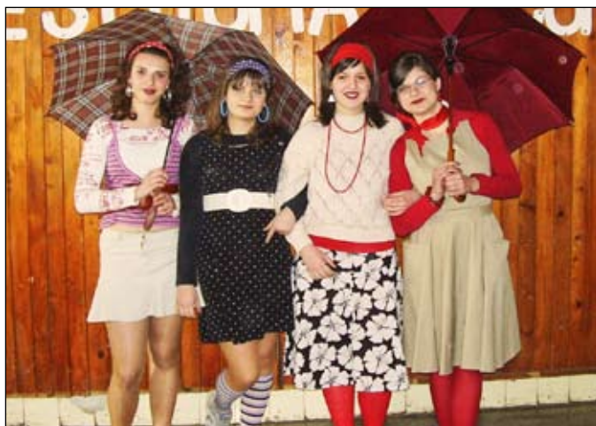
Prvý apríl sa v škole v Klíne prejavil netradičným maskovaním jej žiakov