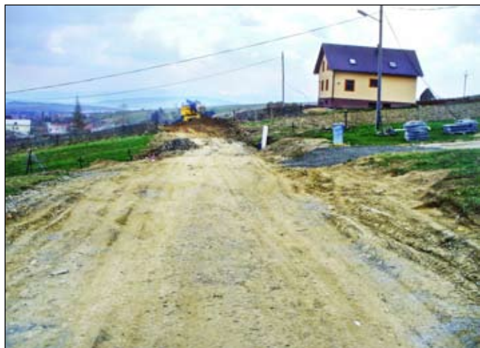
Toboročné zemné práce na Kunovej ulici

V budúcnosti obec plánuje zrekonštruovať tamojšiu kuchynku, vchod do budovy obecného úradu a zakúpiť nový inventár do sály. –red–