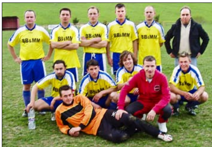
Futbalový tím mužov