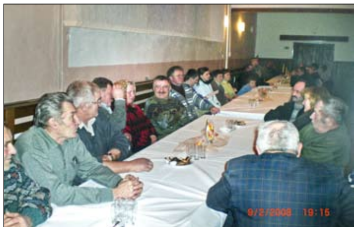
Naši roľníci prišli, aby sa dozvedeli nové informácie

Sála bola plná hlavne staršou generáciou, ktorá bola „odchovaná“ na práci v poľnohospodárstve, ale medzi členmi družstva bolo vidieť aj mladých ľudí, ktorým táto práca učarovala. Snáď sa naše úrodné polia a lúky časom nestanú iba miestom pre rast buriny, a aj miestnemu RSD v Klíne sa podarí poľnohospodárov v ich práci podporiť. – ake-