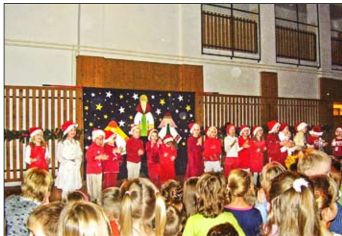
Básničky, pesničky roztancovali všetkých (aj rodičov poobede)