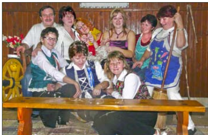
V kroji, či bez kroja – zábava neviazla