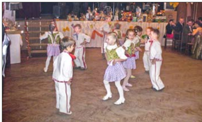
Škôlkari sa brdo vykrúcali. V publiku predsa sedeli aj ich mamičky