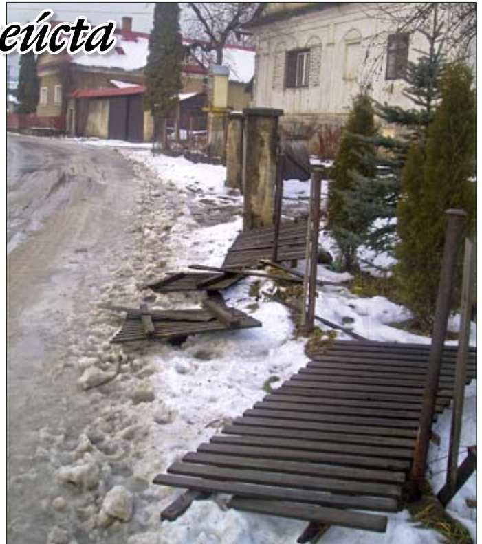
A tento plot dopadol na Ondreja podstatne horšie. To už je o niečom inom než o tradíciách (mimočodom zvláštnych!)

Čo ešte charakterizuje dnešnú dobu je fakt, že demokracia nám prerastá cez hlavu a sme pripravení odsudzovať tých, ktorí sú ešte schopní deti napomenúť. Mali by sme vhodne upozorňovať de-