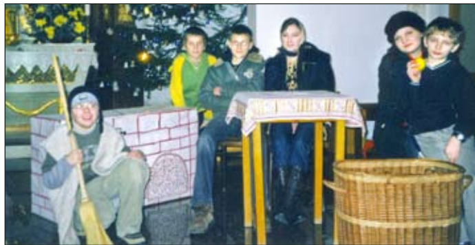
V jednej zo scénok na Jasličkovej pobožnosti

kach, básňach a piesňach. A skutočne sa v dnešnom svete nežije každému ľahko. Ale Ježiš sa aj dnes prihovára každému a deti predviedli scénky, ktoré boli práve toho dôkazom. Poukázali na chudobu, biedu, choroby, hlad, na ťažkosť vo svete, siroty, na nemilosť srdca, na obyčajných ľudí, prostredníctvom, ktorých k nám Ježiš hovorí. Poukázali i na lásku, ktorá je všetkým, na štedrosť a obetivosť