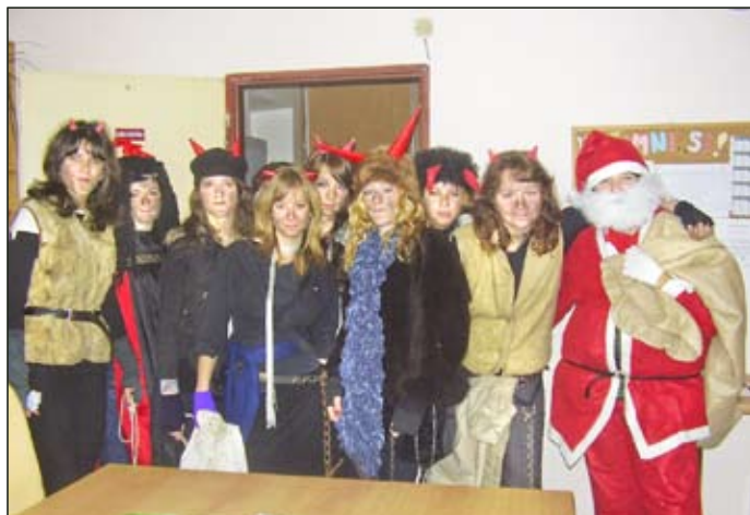
Z deviatáčok sa v deň Sv. Mikuláša stali malé čertice.cez prestávky, so svojim Mikulášom, obdarúvali poslušných alebo strašili malých čertíkov