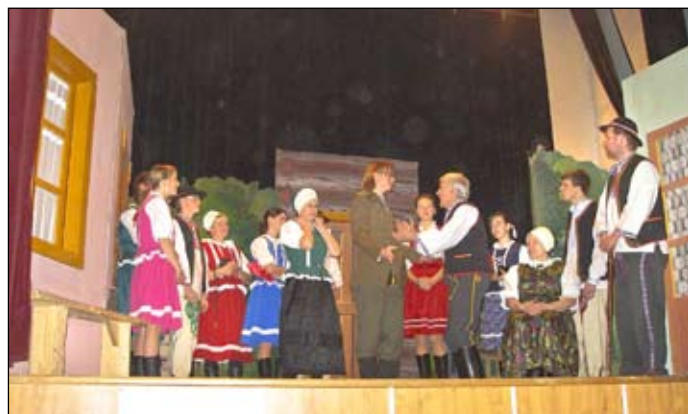
Takto vyzerala scéna nevesty zo žalára

tom sa stretávajú už iba raz do týždňa. A že hrať vedieť, svedčila neobvyklá pozornosť našich divákov, úprimný smiech v úsmevných scénach a dlhý potlesk. – red