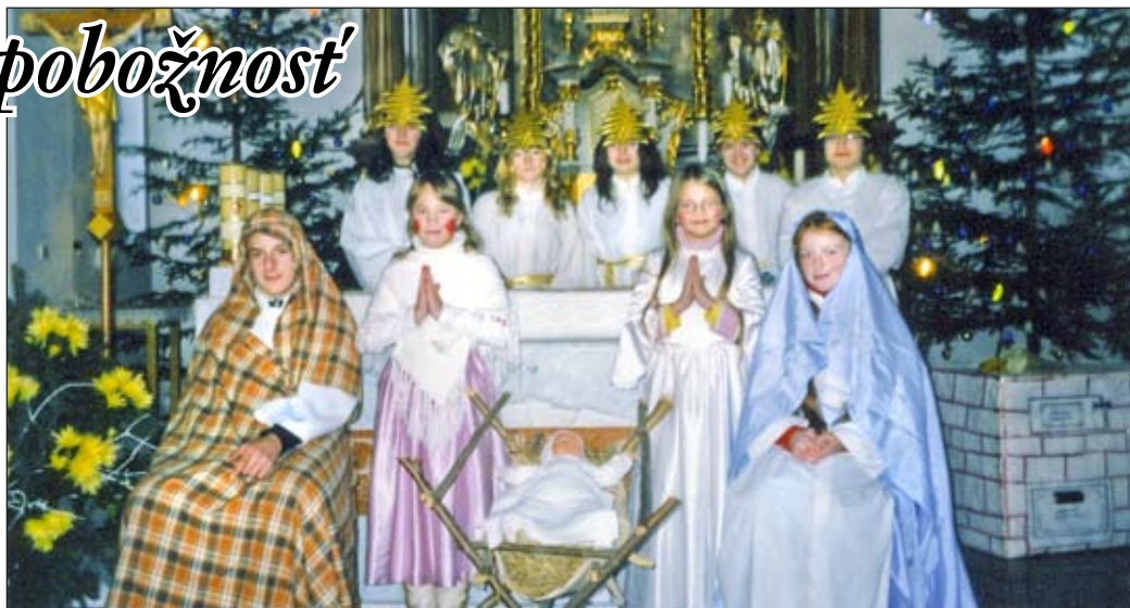
Pre deti bolo ctou stvárniť postavy v živom betleheme

Ako to asi mohlo vyzeráť v Betleheme pred 2000 rokmi? Ako priniesť Vianoce do každodenného života? Rok čo rok hľadajú a dávajú deti na tieto otázky odpoveď a svedectvá v scén-