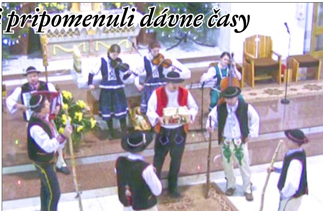
Príchodom betlehemcov do kostola každému zaplesalo srdce radostou i spomienkou

„Pripravovali sme sa asi dva týždne. Niečo sme oprášili, niečo pridali, aby naše vystúpenie bolo zase iné,“ povedali nám. Dokopy ich dala láska k hudbe a tvorivosť, ktorú nesporne majú. Naši „pastieri“ a muzikanti v krojoch navštívili počas vianočných sviatkov aj Zubrohľavu, Bobrov, Námesto-