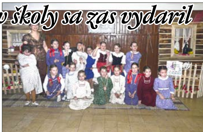
Naše tanečnice z programu so svojou p. učiteľkou