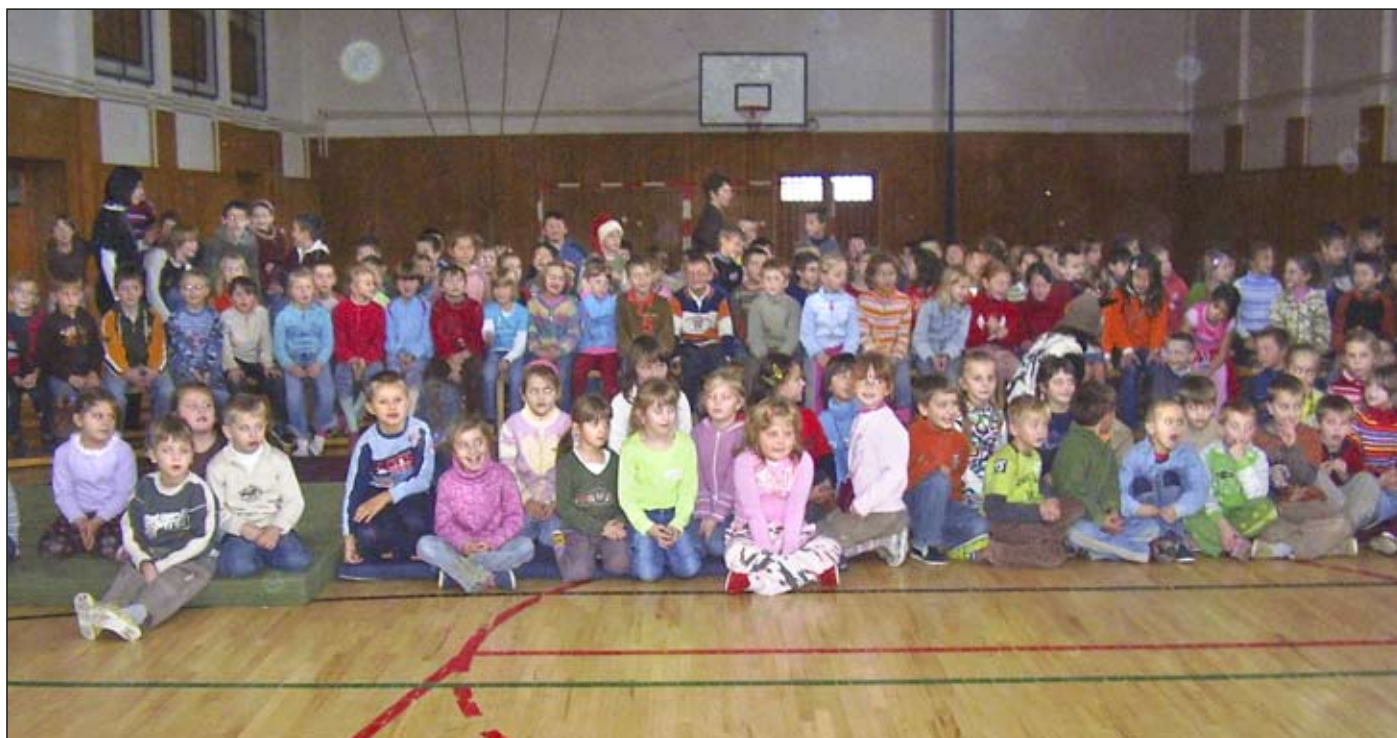
Na generálke sedeli namiesto rodičov spolužiaci vystupujúcich