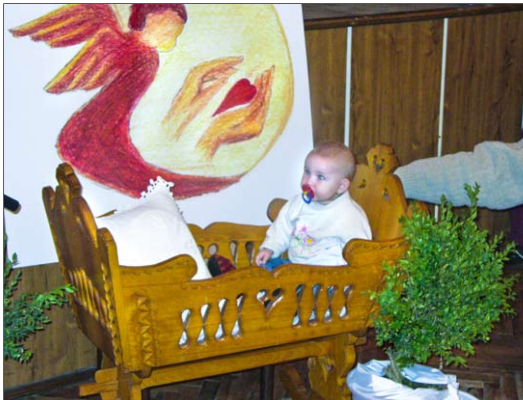
Detičky zapózovali v kolíske