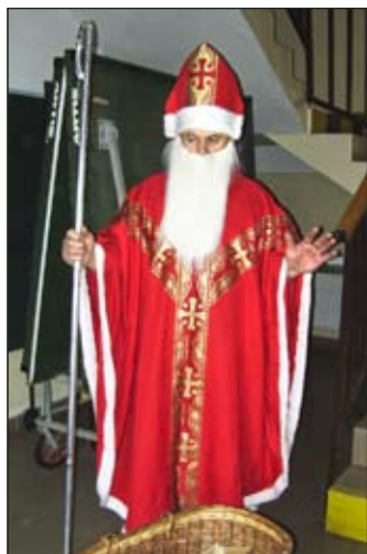
Mikuláš zavítal do školy

V rozprávkovej atmosfére vianočných dní sa niesol celý december, počnúc obrovskou mikulášskou nádielkou. Štedrý Mikuláš nechýbal v škôlke, v škole, v kostole a ani v domovoch.