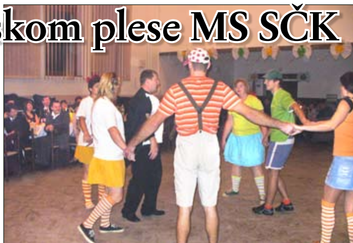
Návrat dospelákov do detských čias rozsmial celú sálu

Naši členovia sa vedľa zabaviť a aj iných pobaviť. Nebolo tomu inak ani teraz v úsmevnom programe. Okrem toho si každý, kto mal chuť, mohol zmerať svoje sily v zatĺkaní klinecov do dreveného klátu. O polnoci zavládlo v sále napätie, keďže sa začala losovať tombola, ktorá bola, vďaka sponzorom, veľmi štedrá. Pekným momentom lo-