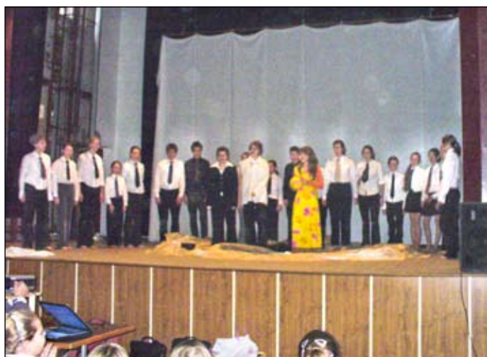
Mladí prezentovali myšlienky, ktoré trápia (alebo by mali trápiť) ľudstvo dnes