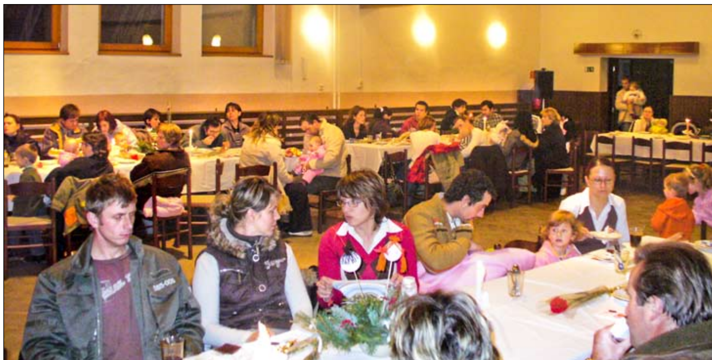
Sála sa zaplnila rodičmi s ich ratolestami

Aj napriek skutočnosti, že mladí ľudia začínajú meniť svoj životný štýl a rodí sa menej detí, treba podotknúť, že v Kline je demografický vývoj priaznivý. Počet obyvateľov pribúda, čo potvrdzuje aj fakt, že k 30. 11. 2007 sa v našej obci narodilo 42 detí a zomrelo 17 ľudí. — red