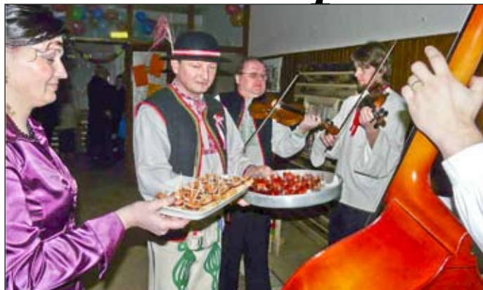
Takže žiadne „chlebo a solou“?

Tohoročný Školský ples bol vyvrcholením fašiangov a niesol sa v ľudovom duchu. Rekvizity drevenej dedinky s prvkami tradičnej ľudovej kultúry: kanapa, cep, voz plný slamy, pluh pod okienkom drevenice, hneď zaujali vo vstupnej hale kultúrneho domu.