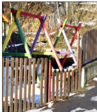
Takto si napr. niekto na „slávení Ondreja“ len si tak „zakopal“ do plotu pri MŠ a zničil ho

ti a mládež, ak sú nezdvorilí, vyrušujú, ničia, čo sa ničiť nemá a nie kritizovať tých, ktorí ešte majú odvahu ich upozorniť a riskovať prípadný odvetný útok.