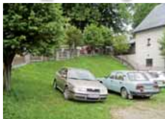
„Záhrada MŠ“ teraz

Ohradená plocha pri starej škole, bývalá „záhrada MŠ“, bude mať novú podobu.