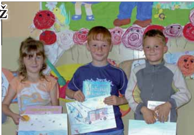
Vítazní výtvarníci z I. A

Vybratí žiaci nakoniec predviedli spolužiakom svoje práce i s príbehom, ktorý si k obrázku pripravili. MS SČK ich za ich tvorivosť, fantáziu a cit odmenil knihami. – red