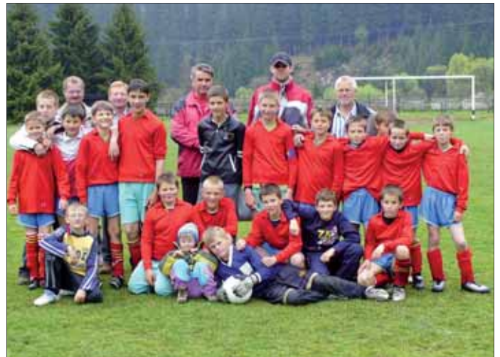
Futbalové družstvo mladších žiakov z Klinu

KOLO: 26. Klin – Zuberec 6:2 (3:2), góly: Kosmeľ 4, Sunega 2; 25. Mutné – Klin 2:3; 24. kolo Klin – Hruštín 3:0 (1:0), góly: Svetlák, Kosmeľ, Klozik; 23. Oravská Polhora – Klin 1:1 (0:1); 22. Klin – Žaškov 2:0 (1:0); 20. Medzibrodie – Klin 1:0 (1:0); dohrávka – 14. kolo Zákamenné – Klin 6:1 (3:1); 19. Klin – Zubrohlava 0:3 (0:2); 18. Dolný Kubín B – Klin 6:0 (4:0); 17. Klin – Oravská Lesná 4:3 (2:1); 16. Oravská Jasenica – Klin 1:2 (1:1); 15. Klin – Mutné 3:1 (2:0).