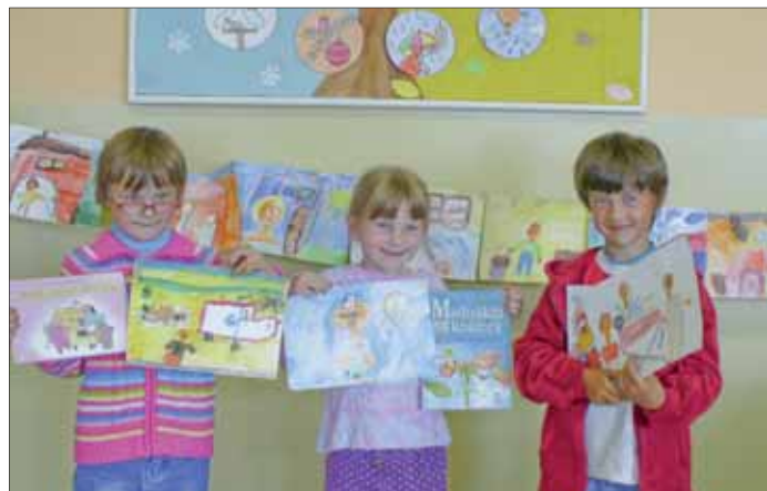
Tí najlepší z I. B