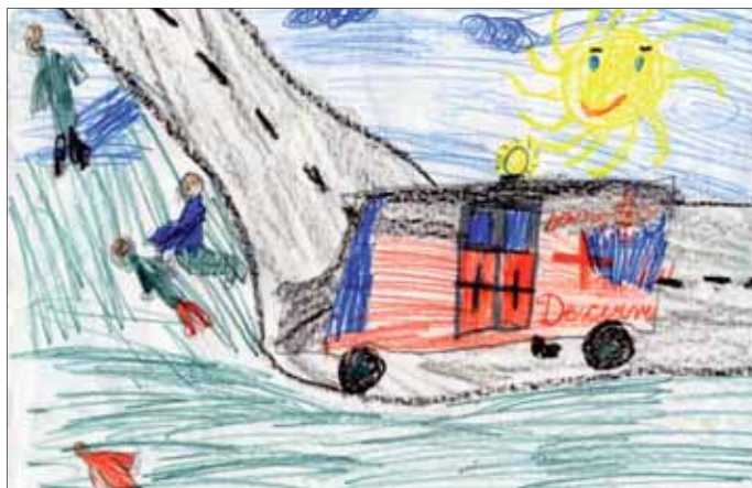
Kresba, Šimon Topor, I. A, I. miesto