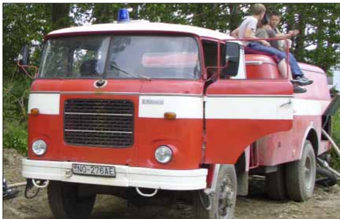
Dnešné používané basičské vozidlo