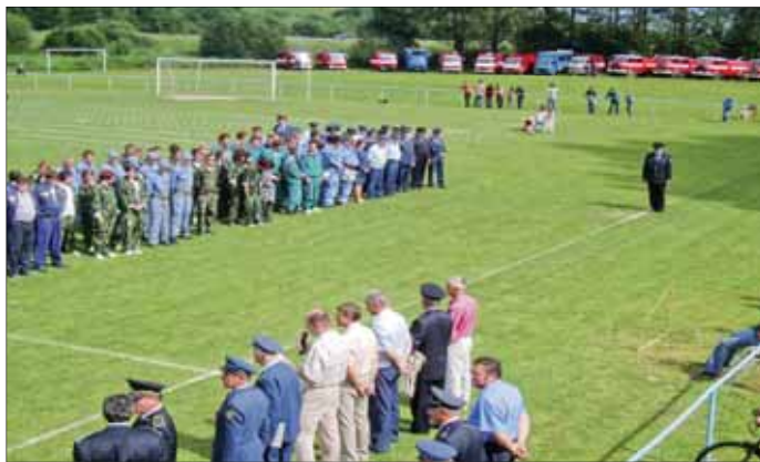
Nástup družstiev pred začatím súťaže

Druhá disciplína – požiar na štafeta 8x50 m, predstavo-