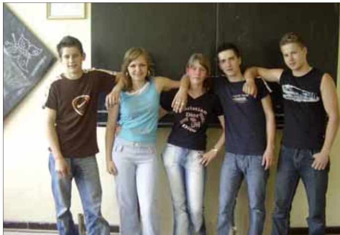
Jedna z posledných fotiek deviatikov základnej školy

s učiteľmi.“ „V posledný školský deň si podáme ruky so všetkými mladšími spolužiakmi. Budeme spievať tradičné pesničky, ako: Zazvoň zvonečku, Nie sme zlí, Škola je tu s nami, ...“