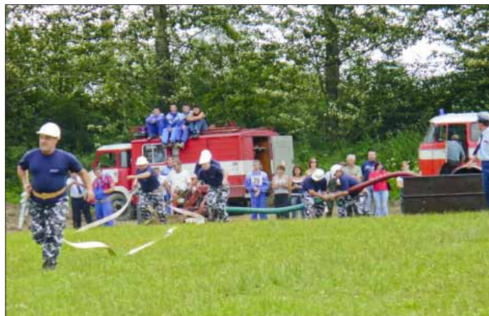
Kliňania v akcii