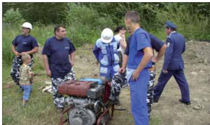
Debata nášho družstva po výkone

Čosi vyšlo, čosi nie. Aj napriek všestrannej spokojnosti kliňanské družstvo žien pociťovalo krivdu, že družstvu žien zo Sedliackej Dubovej sa neodráтали trestné body za zlé odovzdanie prúdnice na štafete. No v porovnaní s výsledkami mužov z Klina naše ženy svojimi umiestneniami vyvracajú predstavu o tom, že povolanie hasiča je mužskou záležitosťou.