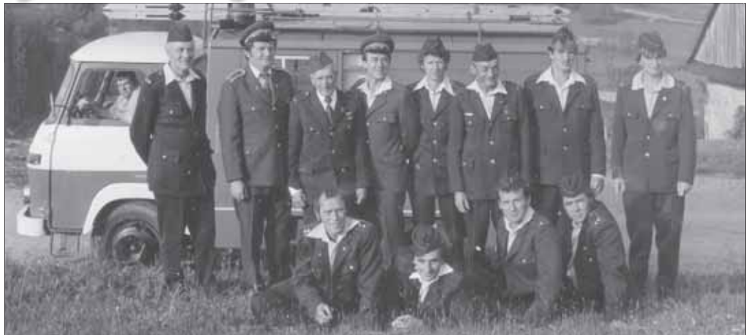
Kliňanskí hasiči v osemdesiatych rokoch

„V roku 1935 bolo v obci 185 rodinných domov, 182 hospodárskych stavieb, ale iba 52 roľníkov malo usadlosti poisťené,“ píše sa ďalej. V tom období mala obec štyri fondy: