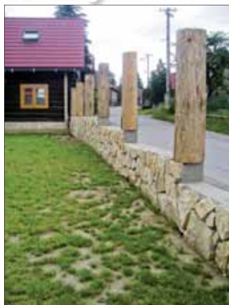
Stavba plotu u Šimurdovcov

Skôr, ako začneme s realizáciou drobnej stavby, s uskutočňovaním stavebných úprav alebo udržiavacích prác, sme povinní vopred ohlásiť stavebnému úradu, v našom prípade stavebnému úradu – obci Klin, zámer na prevádzkanie týchto prác.