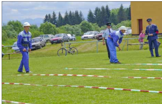
Mladší basiči z Klina na štafete