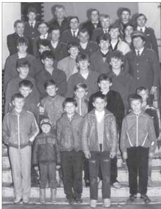
Hasiči s mládežou, ktorá sa venovala hasičskému športu v 80-tych rokoch

chudobin-ský, veterinárny, pomocnú základňu a hasičský, ktoré musela naplňať.