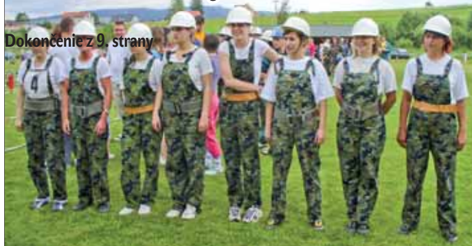
Dokoncenie z 9. strany