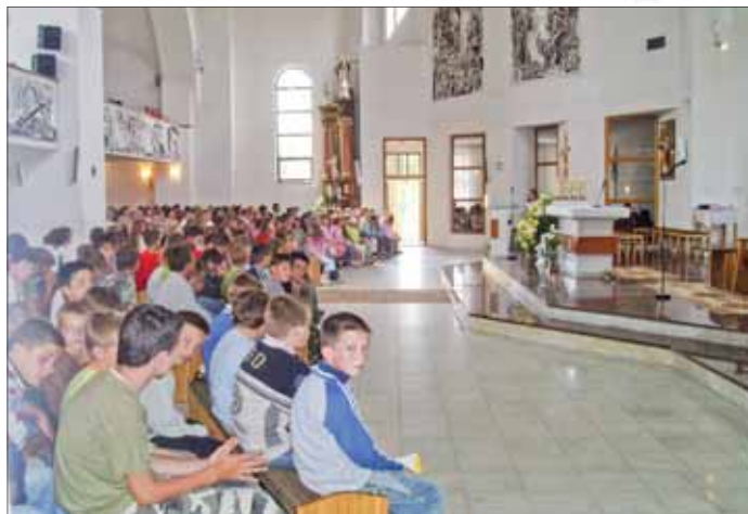
Pred svätou omšou v Kline

V poslednej dobe vzrastá množstvo rozhorčených hlasov z radov žien, ktoré sú nespokojné s fungovaním služby pri upratovaní nášho kostola.