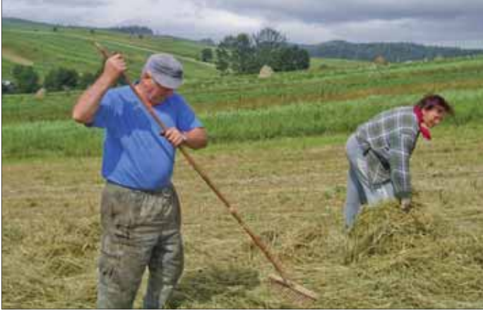
Manželia Revajovci pri sušení sena

Číslo 2/2007 | Júl 2007 | Ročník I. | Bezplatné