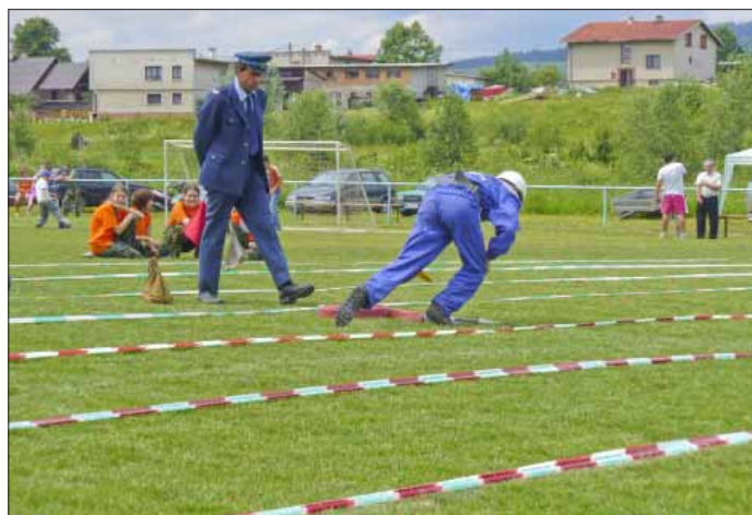
Beží sa ako „o život“